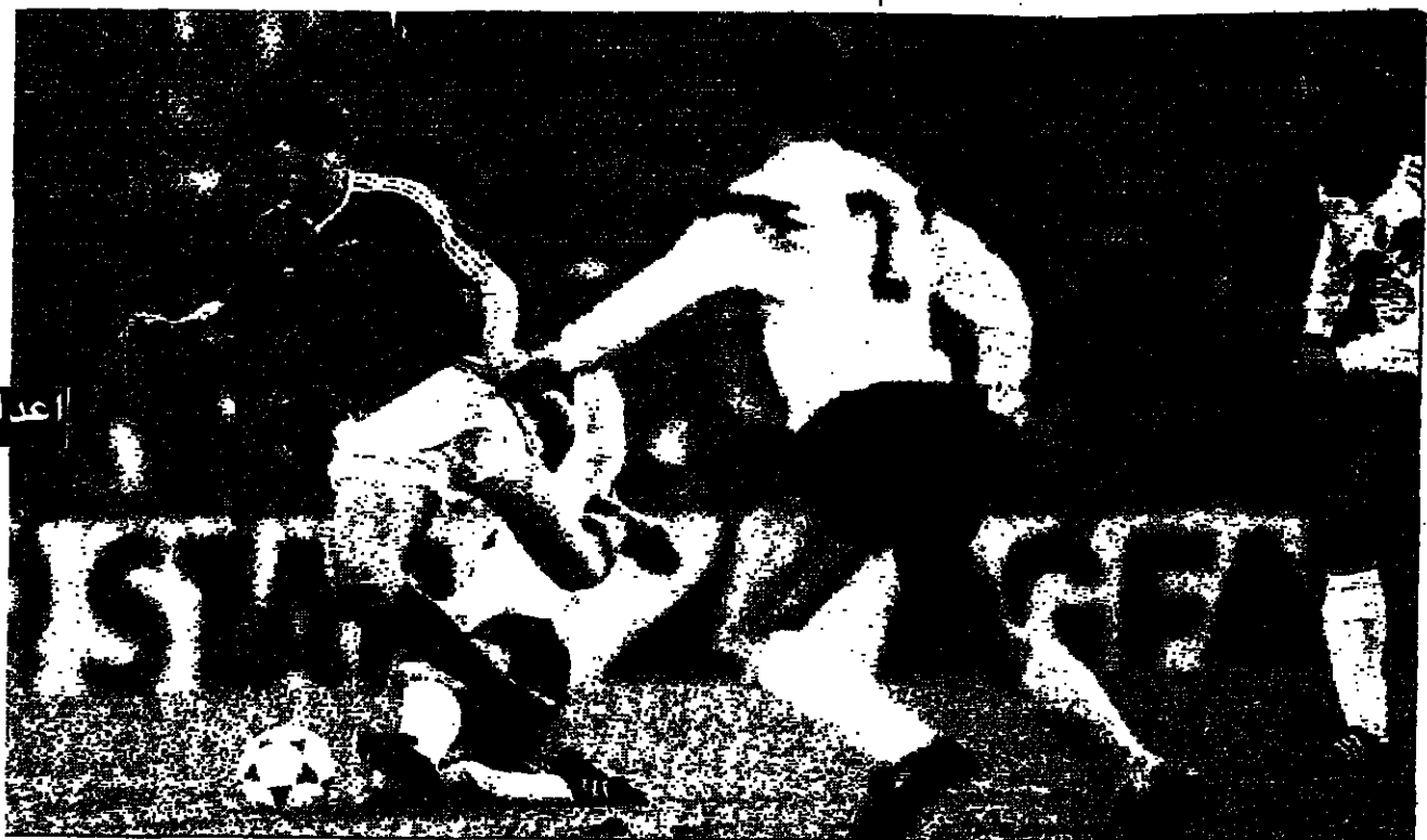
فلان باسطن ( ال اليسار ) يطلب عودة ميكلز !!